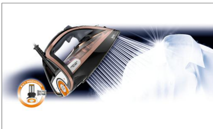
ULTIMATE PURE FV9845E0 broskvová Napařovací žehlička Tefal Ultimate Pure FV9845E0 broskvová FV9845E0